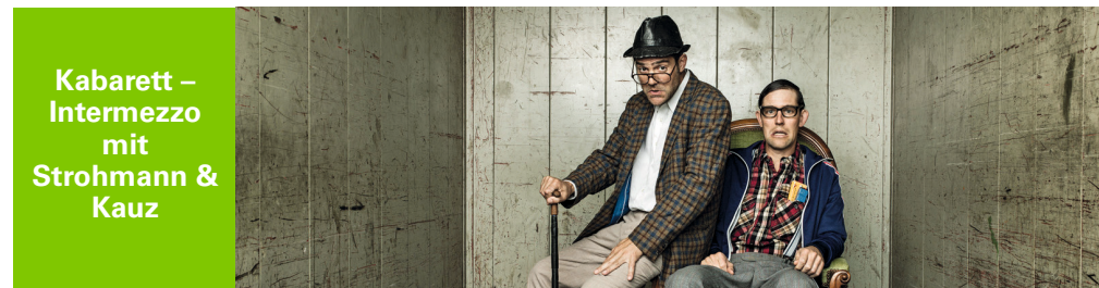
Kabarett – Intermezzo mit Strohmann & Kauz