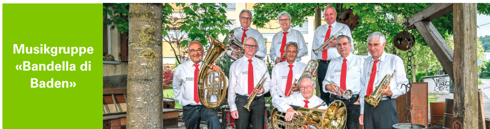
Musikgruppe «Bandella di Baden»